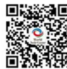
世界合唱比赛微信平台二维码